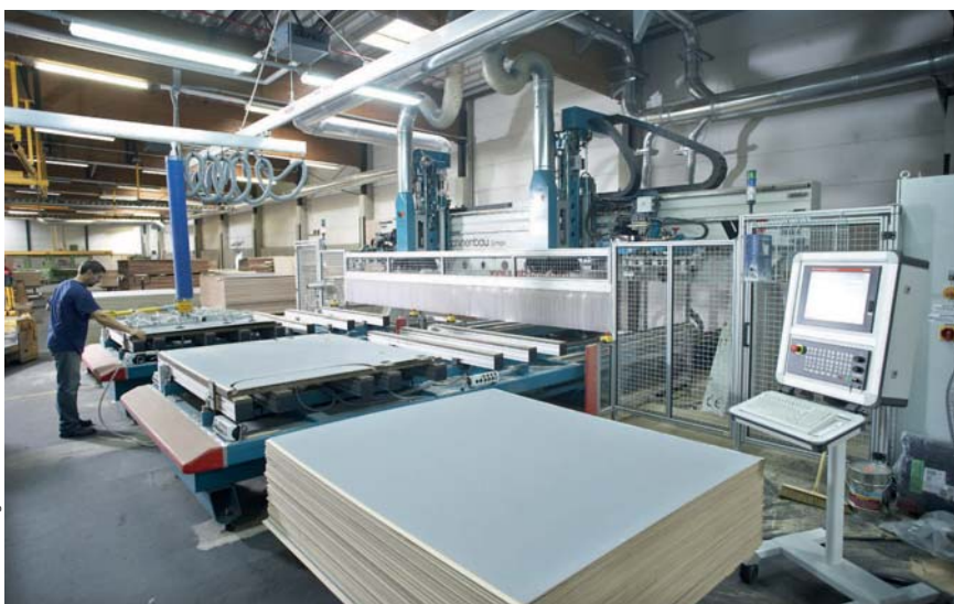
Präzision: Produktion von „Vanycare“-Laderaumschutzausstattung auf CNC-Bearbeitungszentren.

Zwar lassen sich die „Vanycare“-Ausstattungen auch mit den herkömmlichen Verbindungstechniken wie Schrauben und Nieten im Fahrzeug befestigen, dann werden aber in der Regel Karosserieschutzmaßnahmen erforderlich. Als Alternative für die Befestigung der Böden hat der Hersteller eine patentierte Direct-Bond-Surface-Plattenunterseite (DBS) in Abstimmung mit der Klebstoffindustrie entwickelt. Neben der Zeitersparnis bei der Montage bietet das Kleben Vorteile im Hinblick auf Geräuschdämmung und Fahrzeugaussteifung – und zusätzliche Korrosionsschutzmaßnahmen entfallen. ■